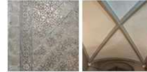
Planta baixa - Hall acces