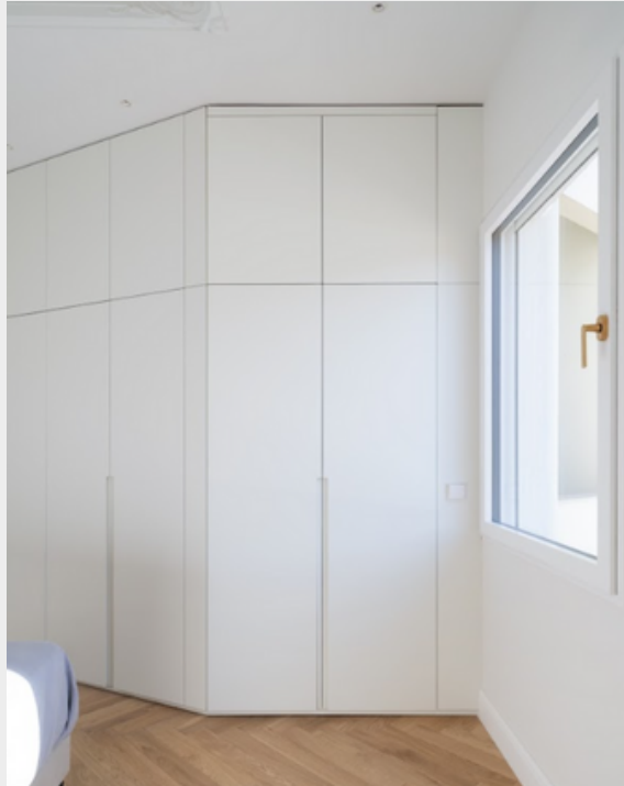
02 Ventana 7 - 8 - 12