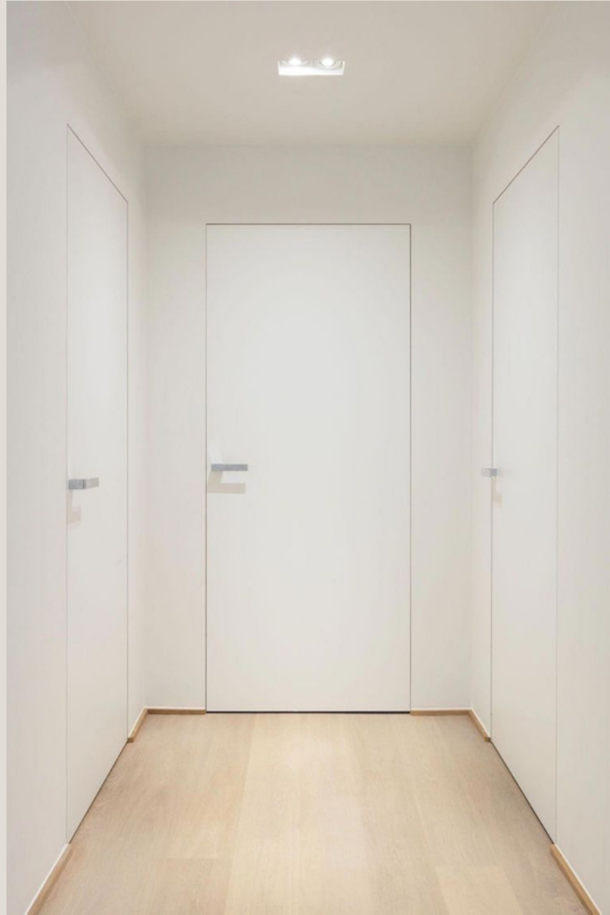
PUERTAS ENRRASADAS SIN MARCOS