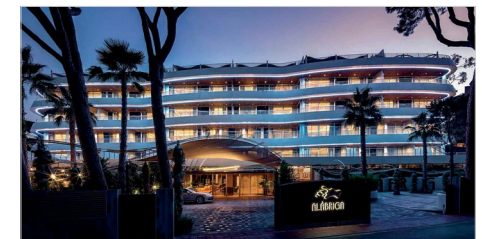
Versión 1.1. 11 de febrero 2022