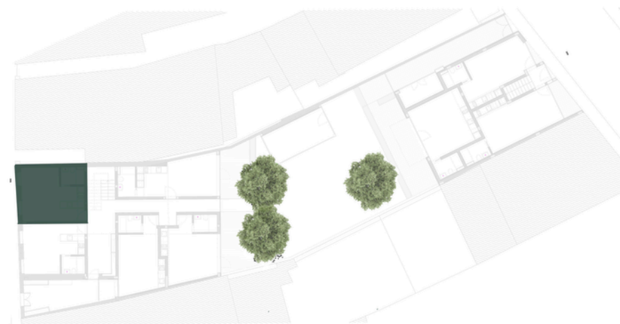
LOCALIZAÇÃO: PISO 1