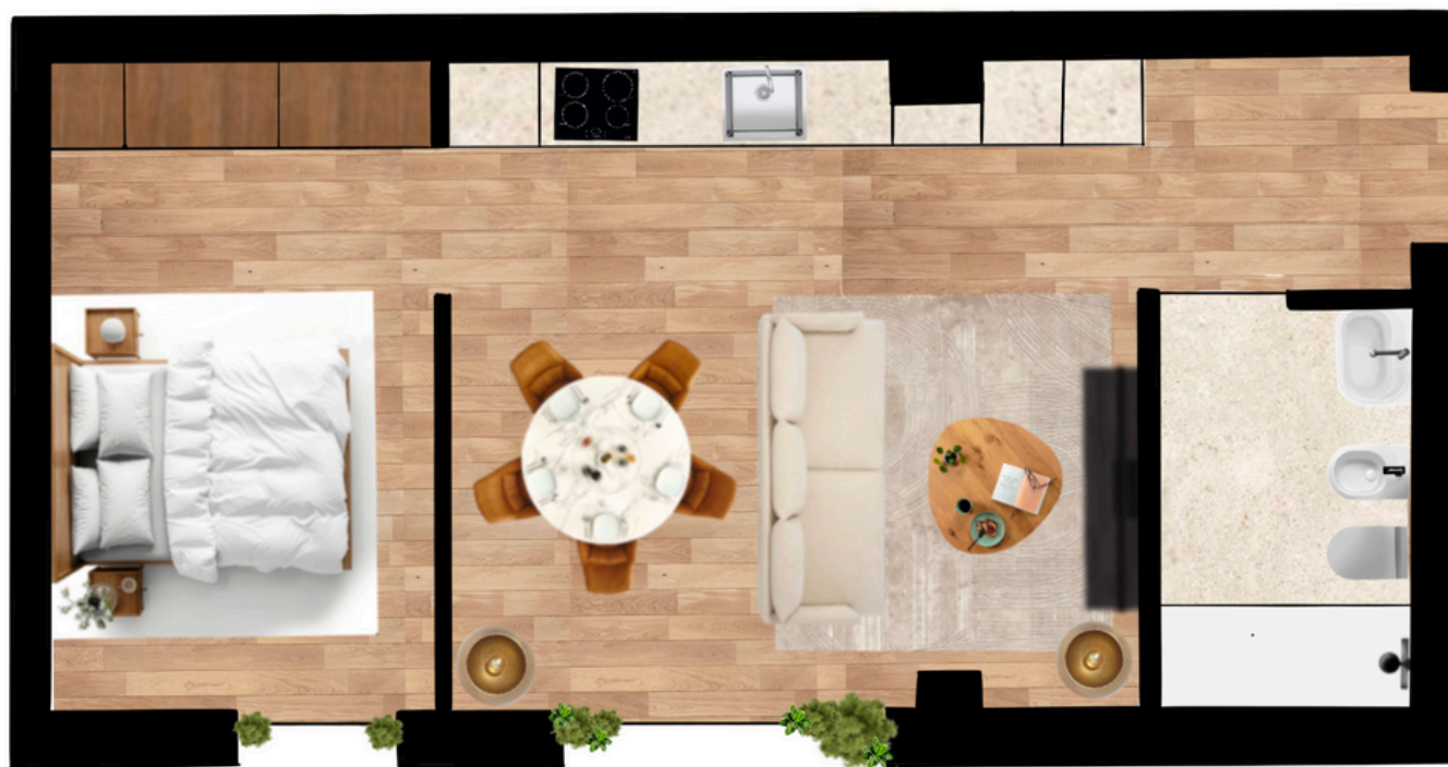
PLANTA DA FRAÇÃO