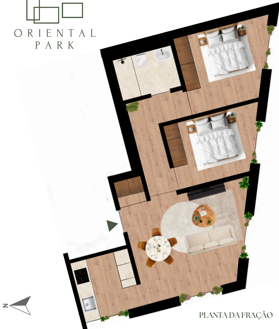
PLANTA DA FRAÇÃO