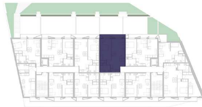
LOCALIZAÇÃO: PISO 3