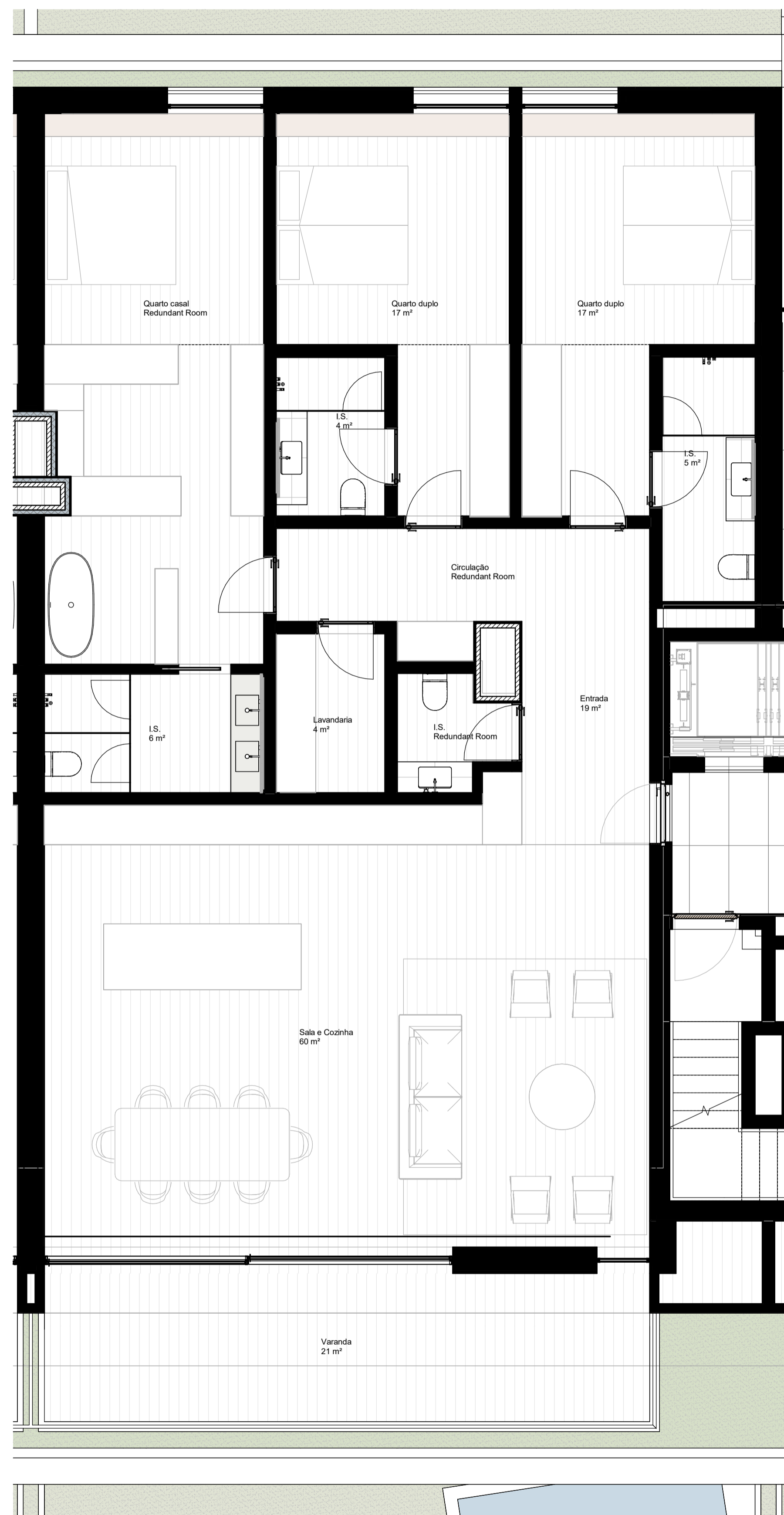
109_AS.T3.5 1 : 50