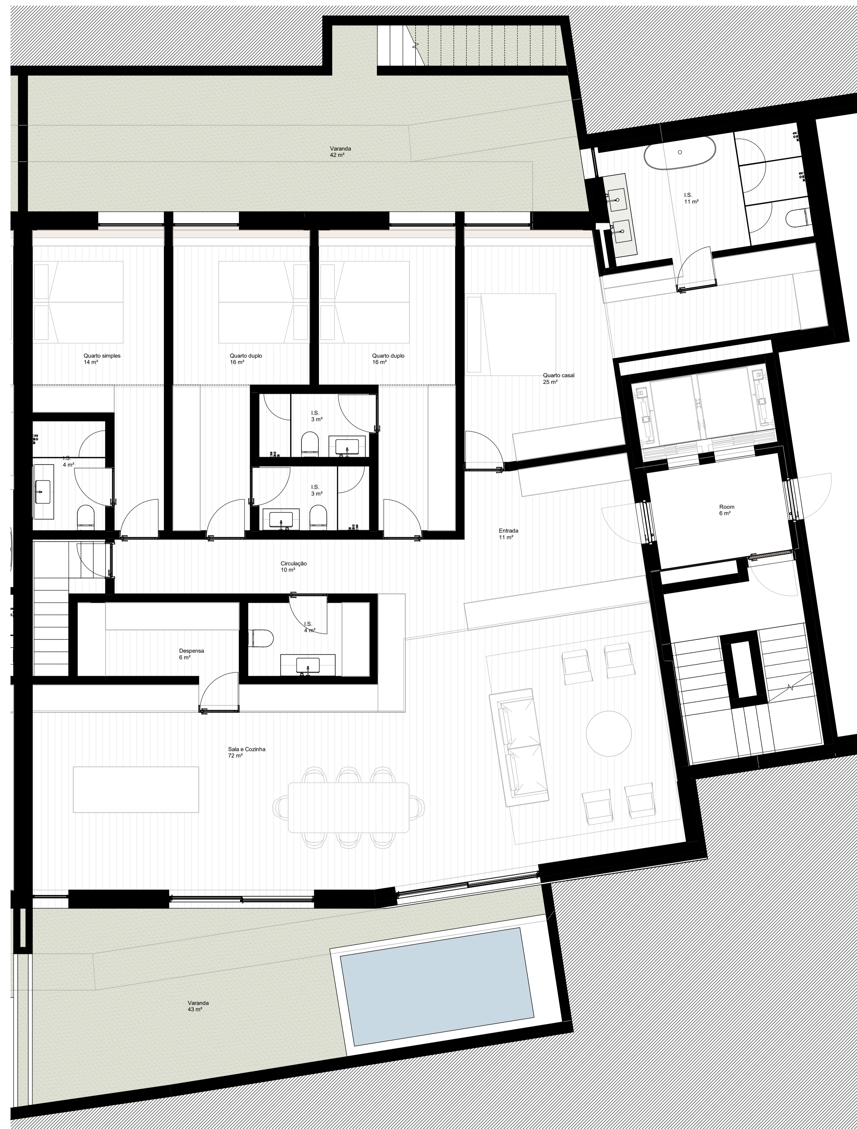
V09_AS.T4.9 1 : 50