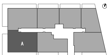
Localização em Planta