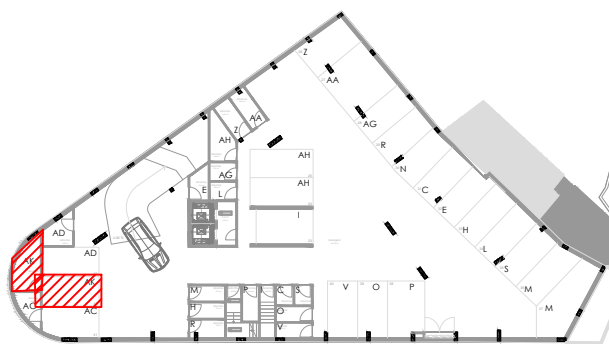
Lugar de Garagem Piso -2