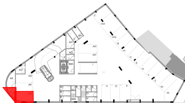
Lugar de Garagem Piso -2