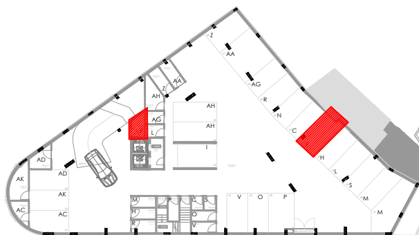
Lugar de Garagem Piso -2