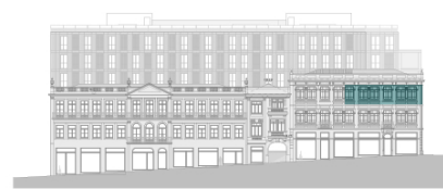
Alçado - Rua Sá da Bandeira