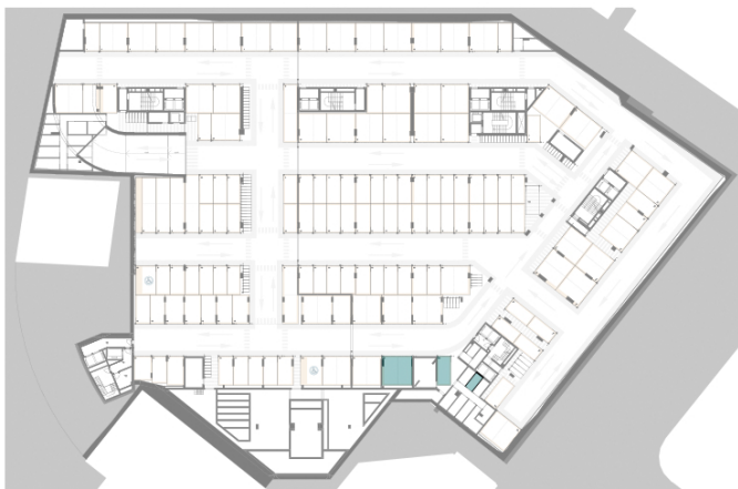
Piso -3 | Étage -3 | Floor -3 Estacionamento e Arrecadação / Parking and Storage Room / Parking et Cave