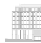
Alçado - Rua do Bonjardim