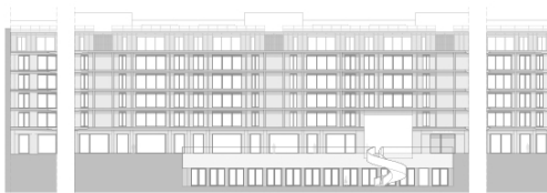
Alçado Sudoeste - Praça Interior

As áreas aqui apresentadas são aproximadas, indicativas e sem caráter contratual. The areas here contained are approximate, indicative and have no contractual nature. Les surfaces sont approximatives et les plans indicatifs, non contractuelles et données à titre informatif. Surfaces en conformité avec la législation portugaise