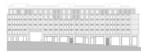
Alçado - Travessa do Bonjardim