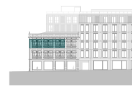
Alçado - Rua Formosa