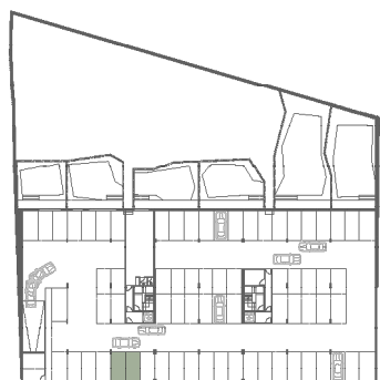
Planta piso -1