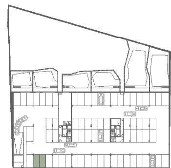
Planta piso -1