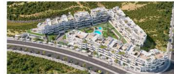
Colinas del Limonar - Málaga