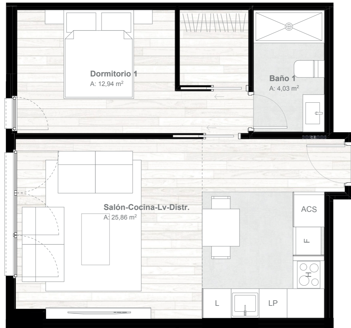
*Salón-Cocina-Lv-Distr.: Superficie integrada de salón + cocina + lavadero + distribuidor

PARCELA RL-A del P.E.R.I. SUNC-R-R.5 "Martiricos" Dos torres de viviendas y hotel. Paseo de Martiricos nº 30, Málaga.