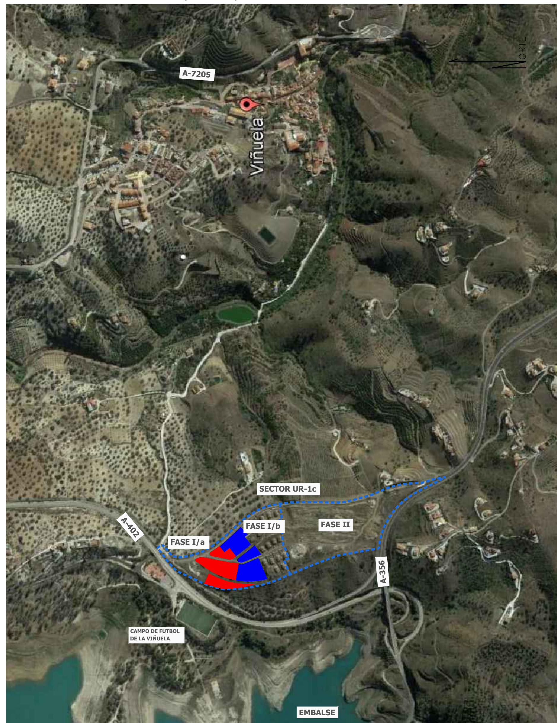
PARCELAS DE LA FASE I/b DEL SECTOR UR-1c.