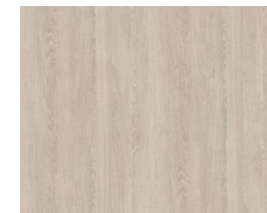
Doors Smoked Oak Puertas Roble humo