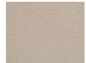
Textil Cactus textile Textil Cactus textile