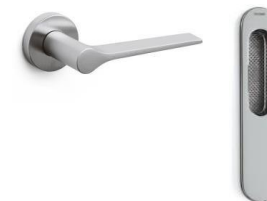
Olivari fittings LAMA model Satin-finish chrome