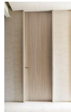
Herrajes Olivari Modelo LAMA Cromo satinado