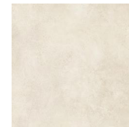
Exterior Gres porcelánico Vela Natural C3 100x100cm