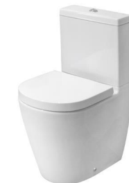
Acro Compact toilet Inodoro Acro Compact