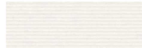
Second bathroom Decorative Old White Porcelanosa 33,3 x 100 cm