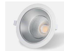
Downlight led CELER