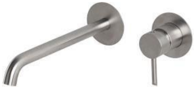
Concealed shower deck shower system.