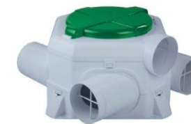
Mechanical ventilation system Sistema de ventilación mecánica