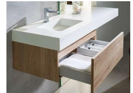
ONE KOLE hanging unit