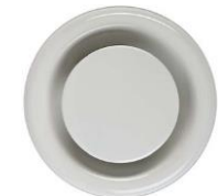
Extractor duct Boca de extracción