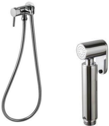
Round stainless steel single tap shower set

Monomando set ducha sanitaria Round inox