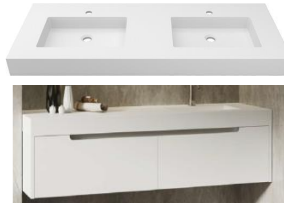
ONE hanging KOLE unit Encimera KOLE Mueble ONE suspendido