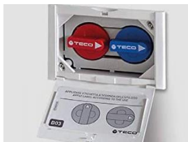
Shut-off valve. Hidden control. Llave de corte mando oculto

Two concealed shut-off valves for hot and cold water in each wet room.