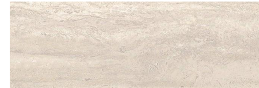
Master Decorative tiles Roma Marfil Porcelanosa 59,6 x 120 cm