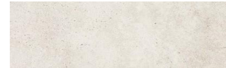
Master & Second bathroom Rectified porcelain tiles Vela Natural Porcelanosa 31,6 x 90 cm