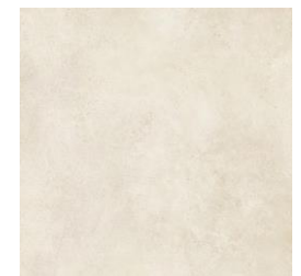
Interior Gres porcelánico Vela Natural 100x100cm