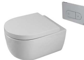
Acro Compact suspended toilet Inodoro suspendido Acro Compact