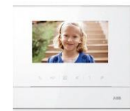
Videoportero Video intercom