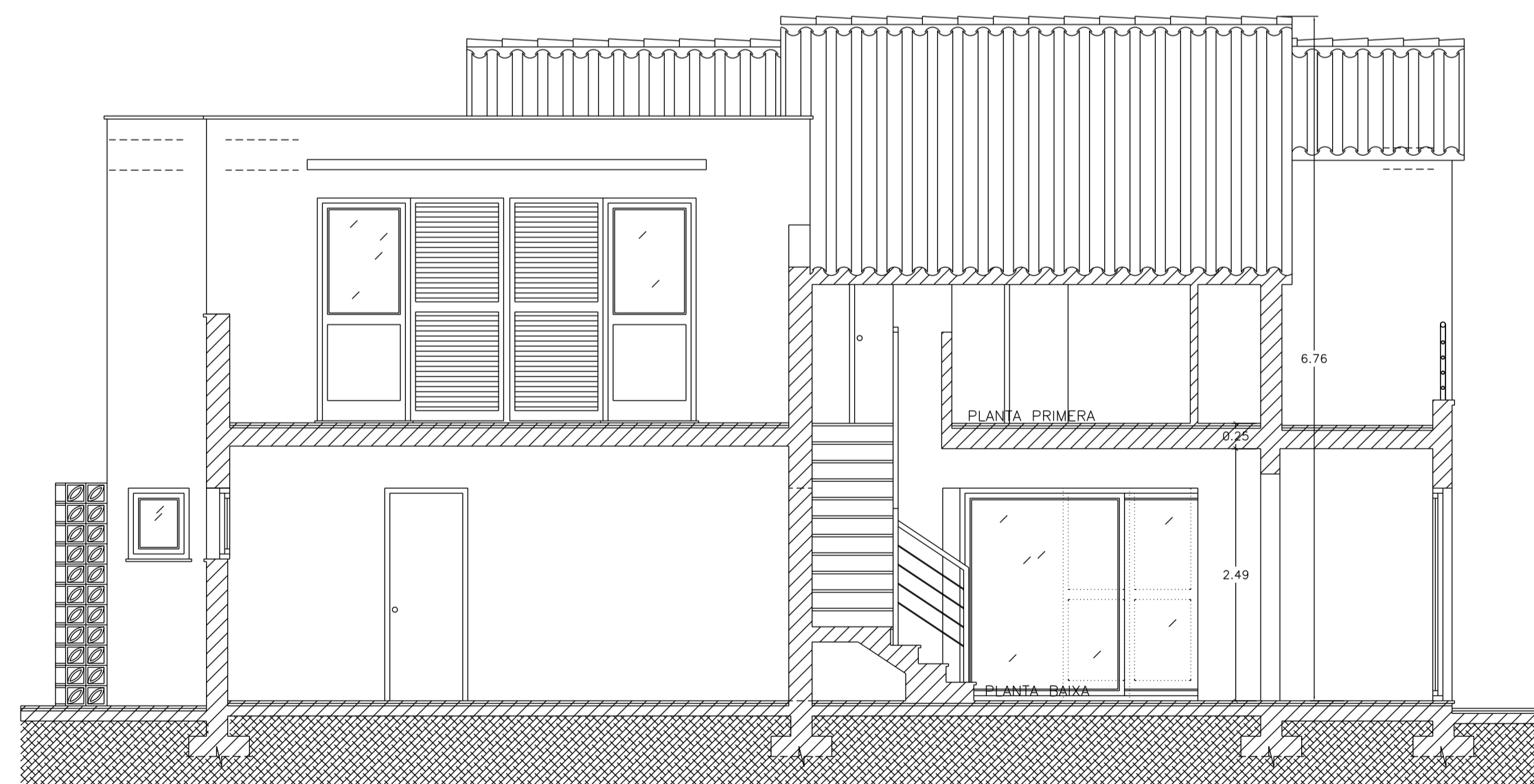
SECCIÓ B-B' REFORMADA

PROJECTE BÀSIC I D'EXECUCIÓ DE REFORMA I AMPLIACIÓ DE VIVENDA UNIFAMILIAR AÏLLADA