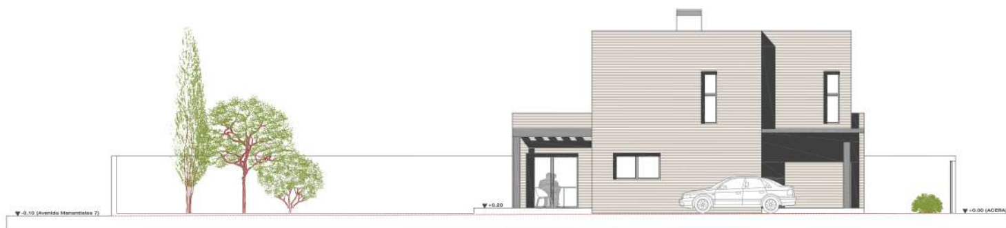
ALZADO LATERAL IZQUIERDO