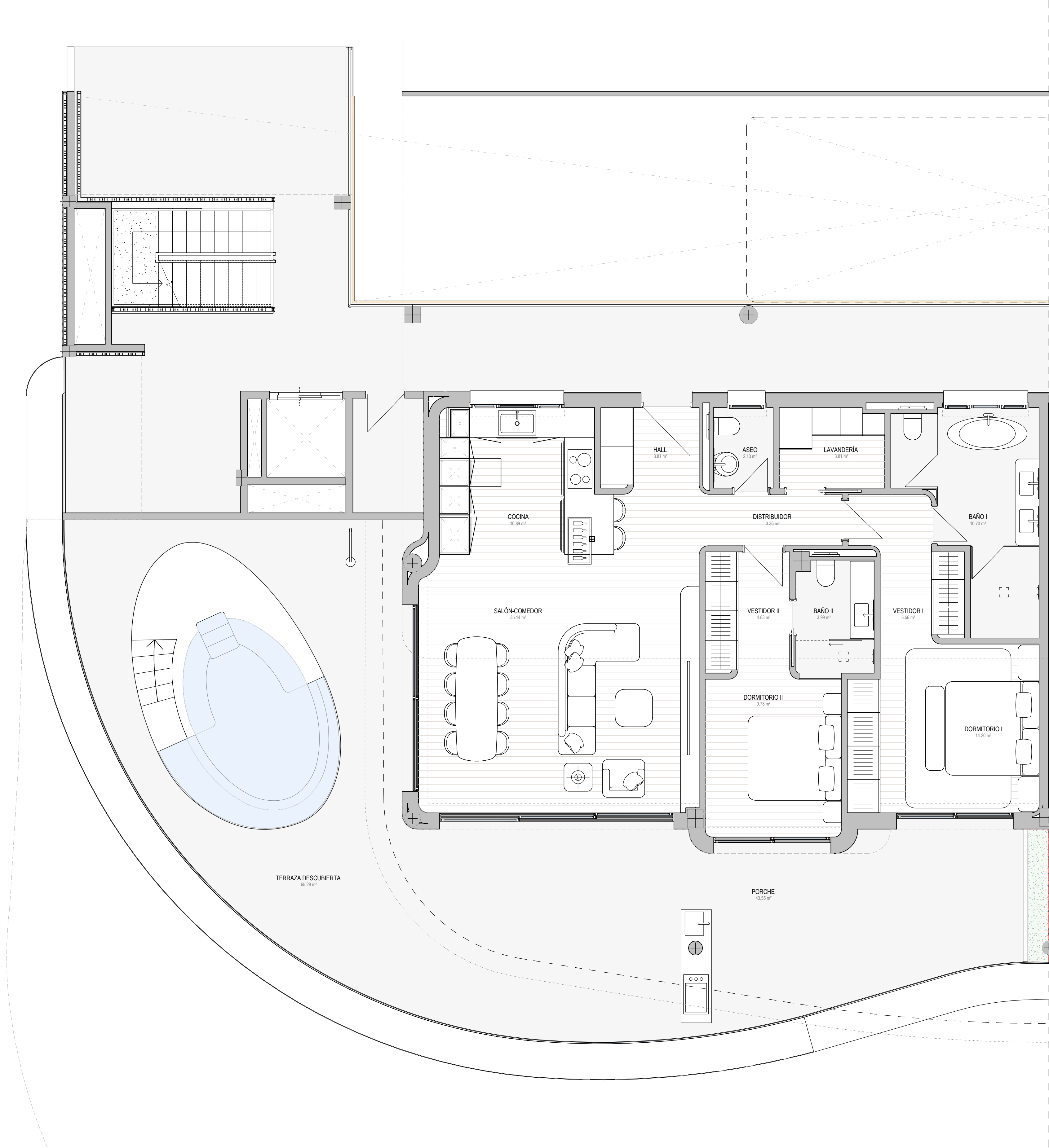
PLANTA PRIMERA _ VIVIENDA 12A ESCALA 1: 50