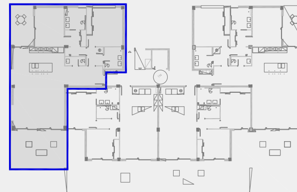
EDIFICIO 4. PLANTA 1ª. VT1a