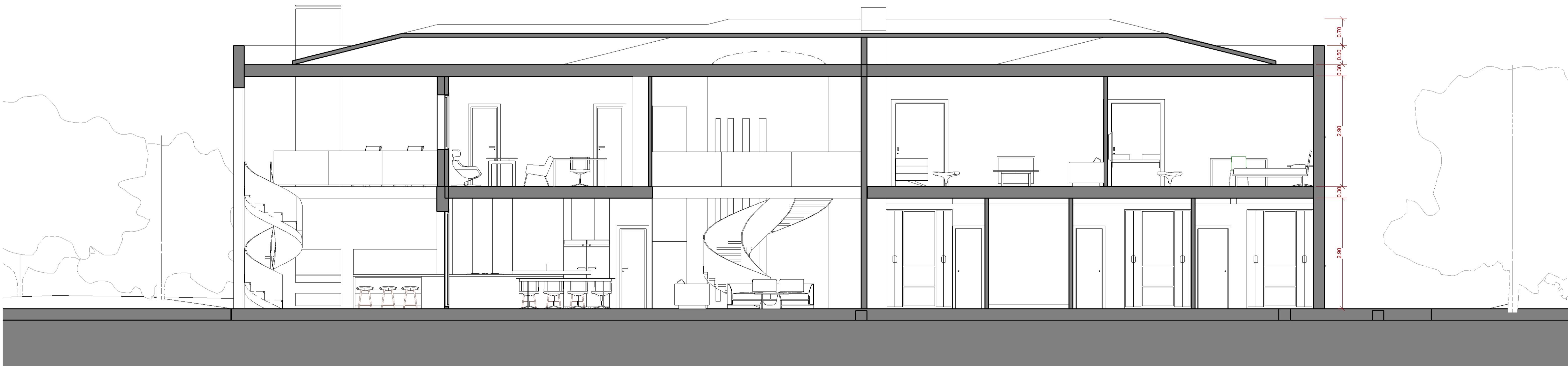
1 imp secció longitudinal A104 1:50

CASA UNIFAMILIAR AÏLLADA A SANT FELIU DE GUIXOLS