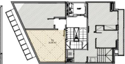
TERRAZA EN P3