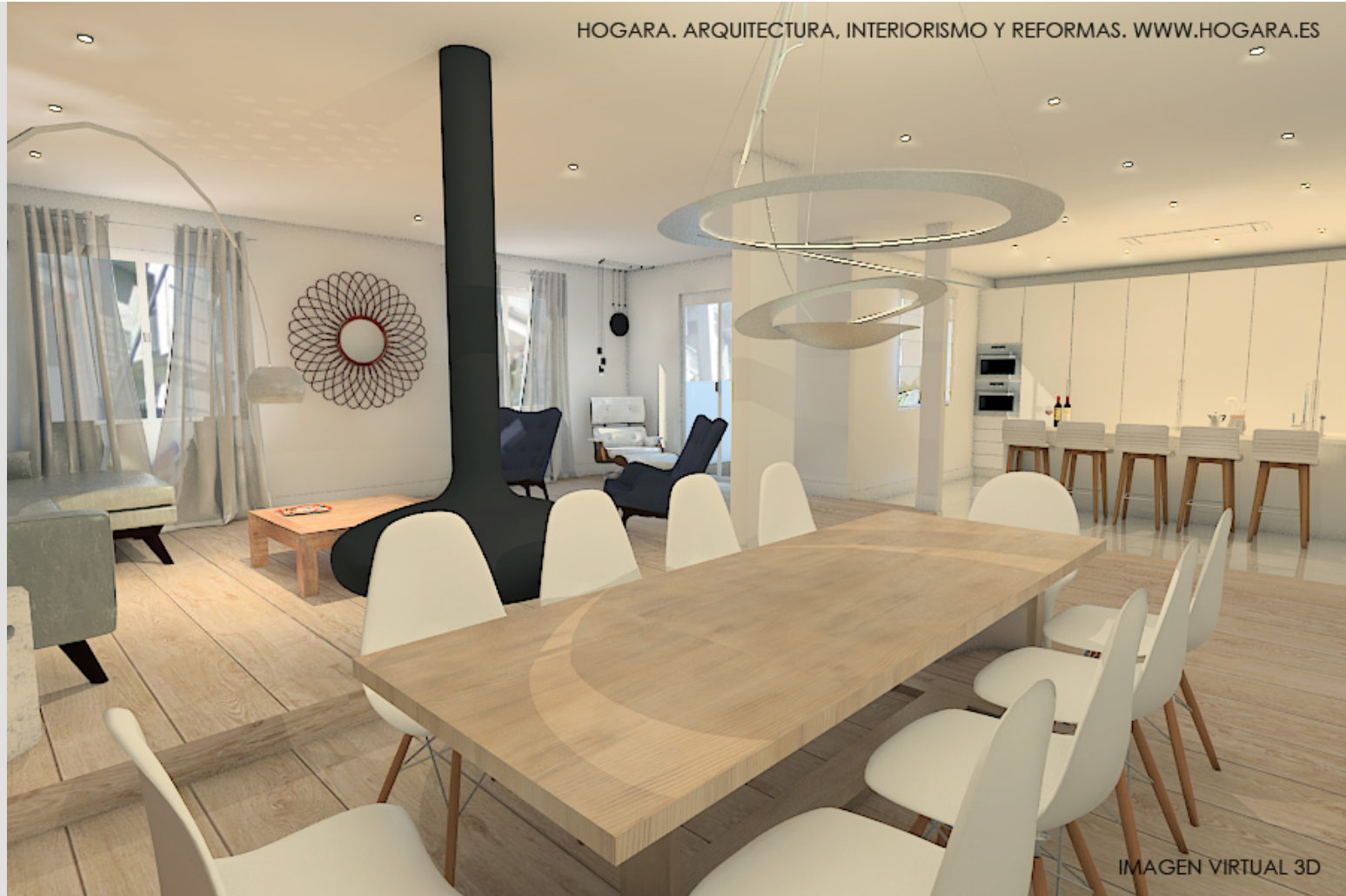
IMAGEN VIRTUAL 3D