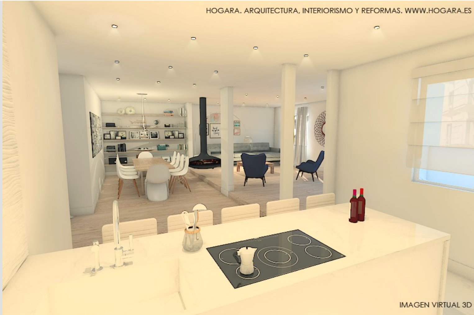
IMAGEN VIRTUAL 3D