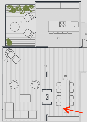
VISTA SALA- COCINA