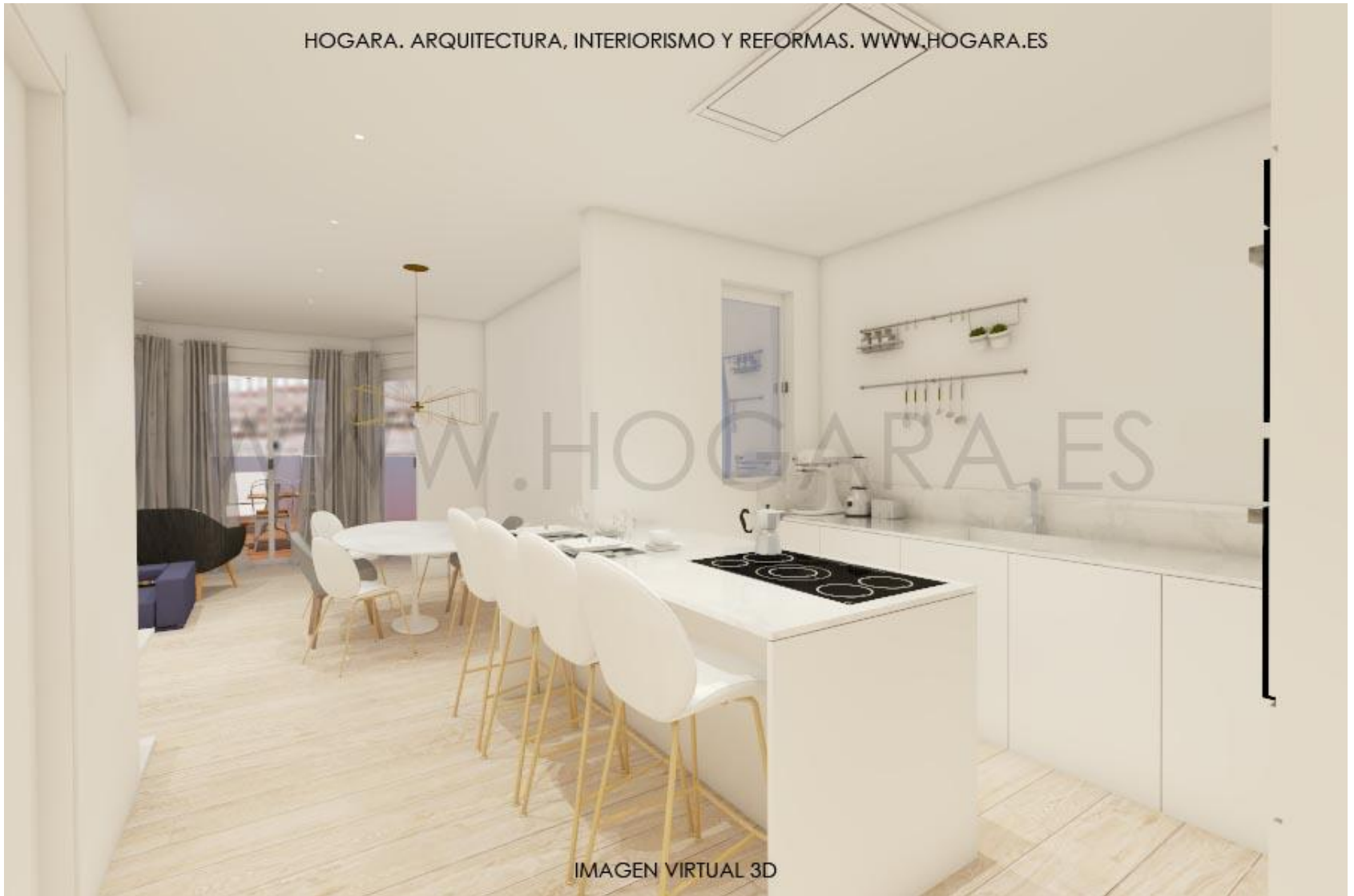
IMAGEN VIRTUAL 3D

HOGARA. ARQUITECTURA, INTERIORISMO Y REFORMAS. WWW.HOGARA.ES