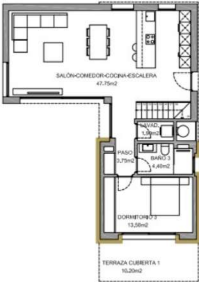
PLANTA BAJA - SUPERFICIES Escala 1/100