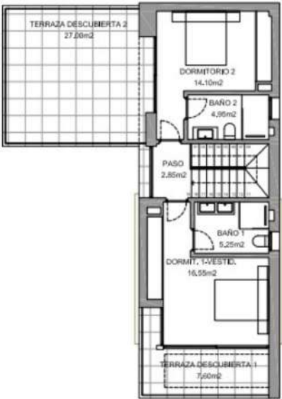
PLANTA ALTA - SUPERFICIES Escala 1/100