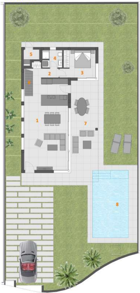
Planta Baja y Parcela