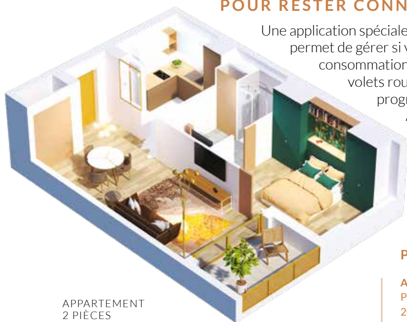
APPARTEMENT 2 PIÈCES

Une application spécialement dédiée à votre appartement vous permet de gérer si vous le souhaitez l'évolution de votre consommation d'énergie, l'ouverture à distance de vos volets roulants, ou encore de simuler une présence en programmant un éclairage durant votre absence. Application évolutive selon vos exigences.