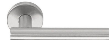
Manetas (negra o plateada)