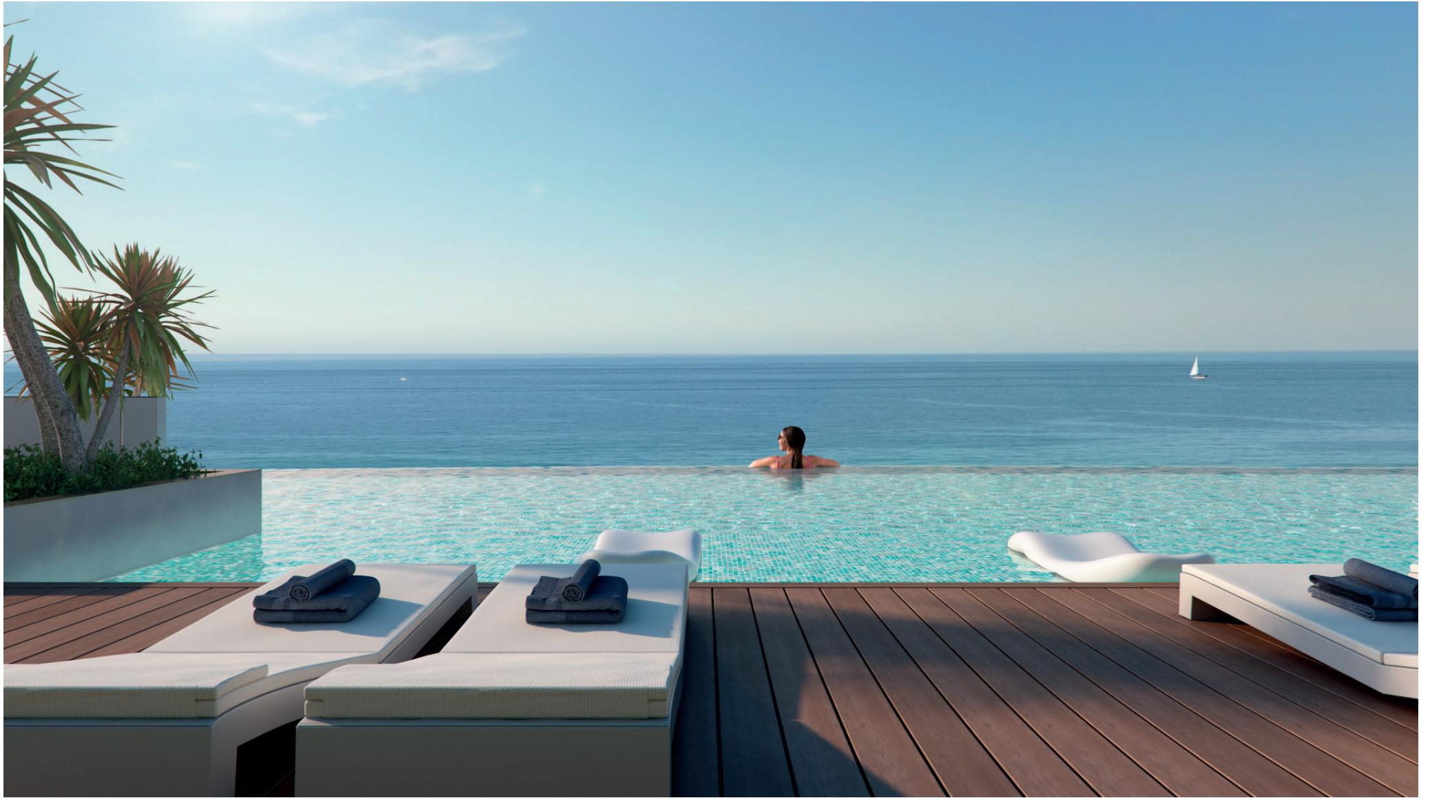
Piscina desbordante Infinity edge pool