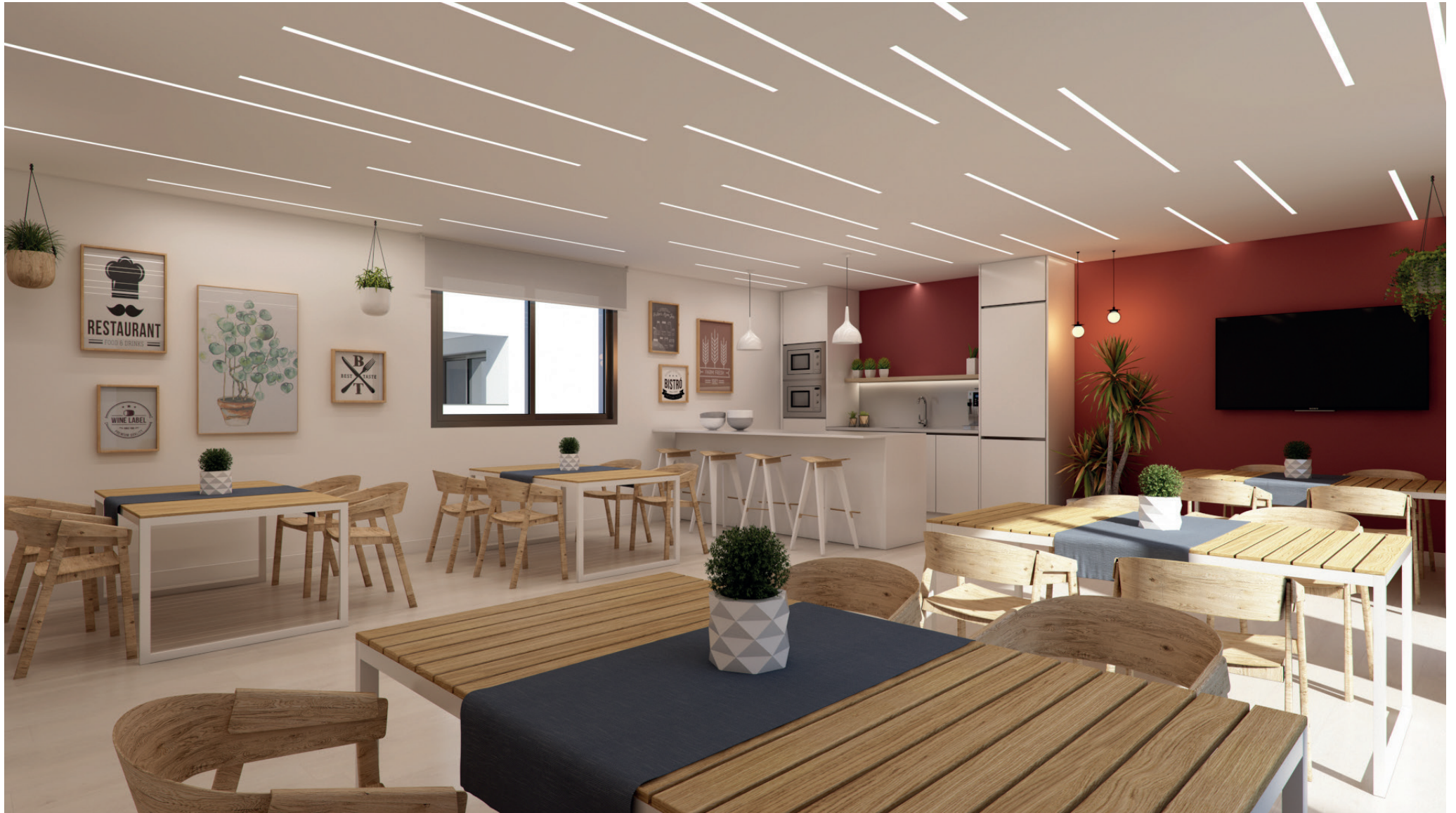
Zonas comunes: sala gourmet y coworking. Ammenities: gourmet room and coworking area.