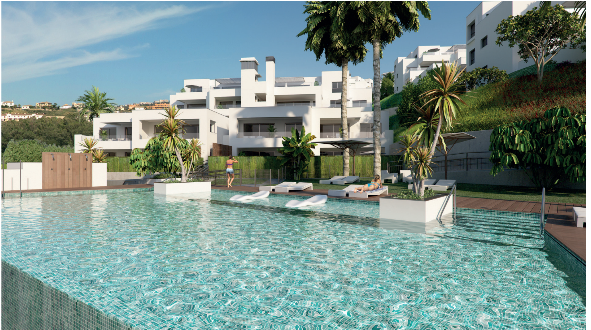
Piscina con tumbonas sumergidas Underwater tanning ledges pool