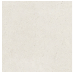
59,60 x 59,60 cm. Mod. Matika Bone de Porcelanosa

En los baños el pavimento será el mismo que en el resto de la vivienda. Gres porcelánico rectificado formato 59,6x59,6 cm modelo MATIKA BONE de PORCELANOSA. Las paredes que no vayan alicatadas llevarán rodapié a juego con el pavimento.