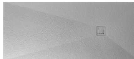
Plato de ducha modelo Slate de Porcelanosa Slate model shower tray by Porcelanosa