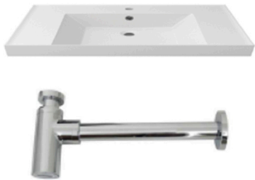
Lavabo suspendido de un seno Modelo ONE - 1000 x 500 mm de Porcelanosa Single wall-mounted ONE Model - 1000 x 500 mm by Porcelanosa