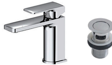
Grifería lavabo monomando modelo NK Concept de Porcelanosa KN Concept Mixer type by Porcelanosa