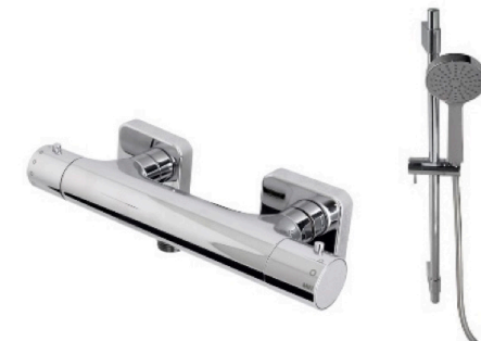
Grifería ducha termostática modelo Urban de Porcelanosa + Pack de ducha Thermostat-controlled Urban taps by Porcelanosa + shower pack

COMPLEMENTOS INCLUIDOS: Espejo. INCLUDED ACCESSORIES: Mirror.