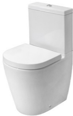
Inodoro a suelo adosado a pared. Modelo Acro Compact de Porcelanosa Toilet floor-mounted against wall, Acro Compact model by Porcelanosa