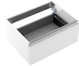
Mueble suspendido bajo lavabo Modelo Spirit de Salgar. Color blanco brillo Gloss white Spirit wall-mounted cabinet by Salgar