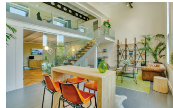
Lucas Fox Costa Brava Property Lounge, Begur