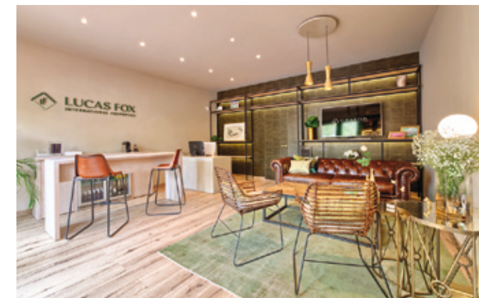
Lucas Fox Marbella Property Lounge