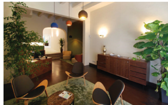
Lucas Fox Sitges Property Lounge