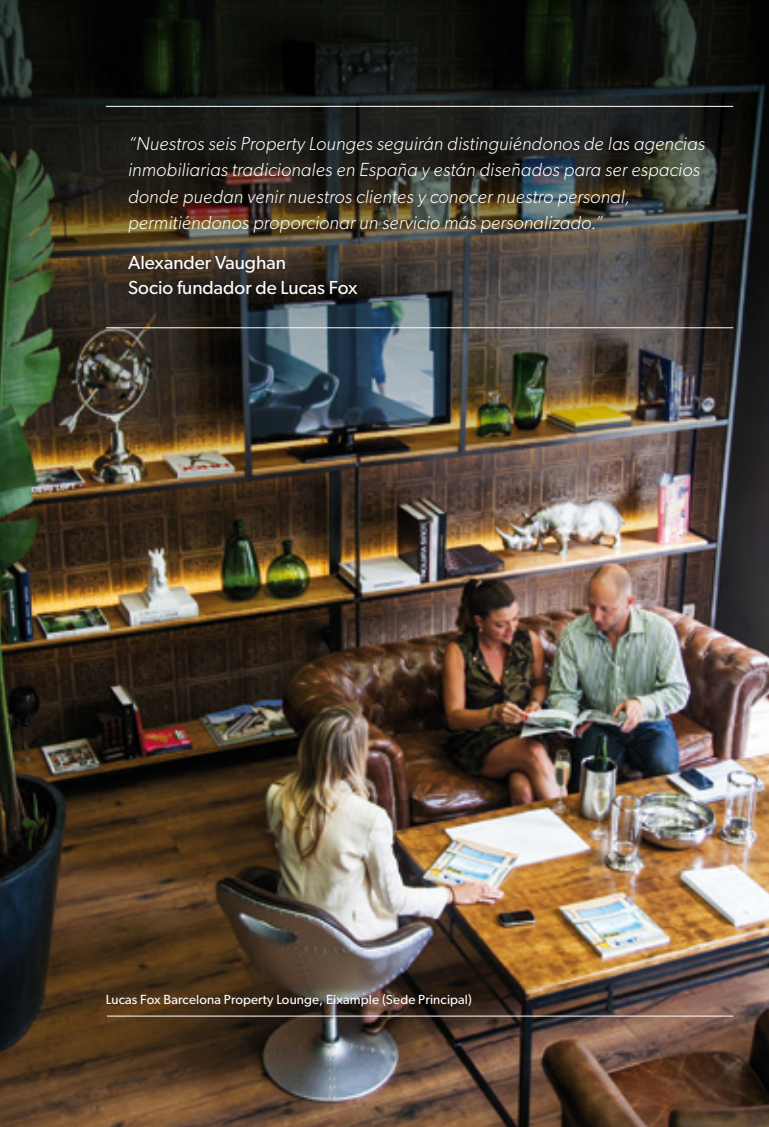
Lucas Fox Barcelona Property Lounge, Eixample (Sede Principal)