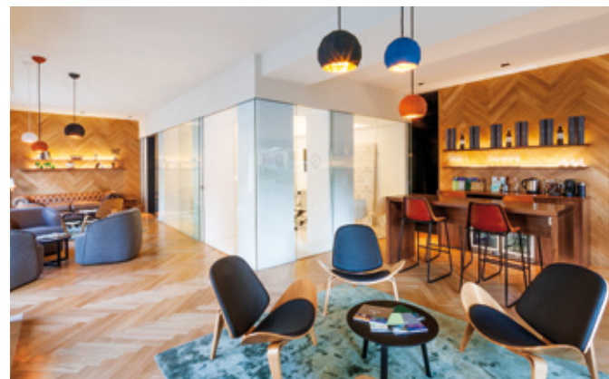
Lucas Fox Barcelona Property Lounge, Turo Park

Lucas Fox dispone de 12 oficinas en 10 zonas, entre ellas seis Property Lounges . En 2013, Lucas Fox inauguró el primero de sus Property Lounges en la sede de la empresa, en el centro de Barcelona. El segundo Property Lounge se abrió poco después en el pueblo de Alella en la costa del Maresme. El 2014 presencié la inauguración de dos Property Lounges nuevos: en la localidad cosmopolita de Sitges y en el distrito de Lujo de Turó Park en Barcelona. En 2015, se inauguraron Property Lounges nuevos en el pueblo medieval de Begur, en la Costa Brava, y en Marbella.