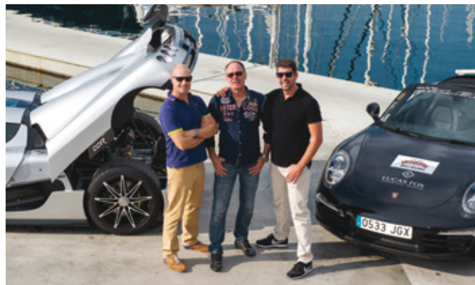
En 2015, Lucas Fox fue el principal patrocinador del Barcelona Big Bang, un glamoroso evento de supercoches que atrajo algunos de los empresarios y emprendedores más adinerados de Europa.

Lucas Fox cuenta con un equipo interno de marketing digital y corporativo y de diseño cuya área cubre relaciones públicas nacionales e internacionales, patrocinios y eventos, redes sociales, optimización de buscadores (SEO) y desarrollo de páginas web. En 2014, Lucas Fox lanzó su nueva marca y revista digital LFStyle ( www.lucasfoxstyle.com ) como respuesta a la creciente demanda de clientes internacionales que desean aprender más sobre los numerosos beneficios culturales y de estilo de vida de España. El blog incluye guías expertas, entrevistas, guías de destinos, historias de traslados, reseñas de restaurantes y mucho más. Se ha convertido en el punto de referencia para compradores extranjeros que quieren comprar una propiedad en los destinos más codiciados de España.