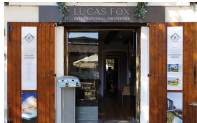
Lucas Fox Maresme Property Lounge, Alella